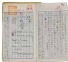
学生時代の 子規のノート(自筆)