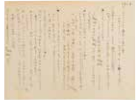
『カント全集』に挟まれていた和辻自筆メモ

和・洋併せて5,000冊におよぶその蔵書には、随所に疑問や論評などの書き込みが見られ、それらを通して、宗教や古典文学、芸能、風土など多岐にわたる広い視野から日本人の精神史を捉えた和辻の思考、研究の跡がたどれる点が何よりも貴重です。