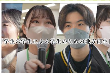
「学生の学生による学生のための地方創生」